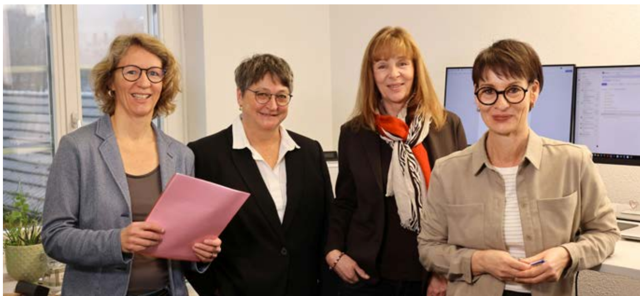
Team der Beratungsstelle Bezirk Zurzach

Ein besonderer Fokus galt auch im vergangenen Jahr unseren freiwilligen Mitarbeitenden. Ihr Engagement ist unverzichtbar, denn ohne ihren Einsatz wären viele unserer Angebote nicht realisierbar. Der Dankes Anlass bot Gelegenheit, diese wertvolle Unterstützung sichtbar zu würdigen.